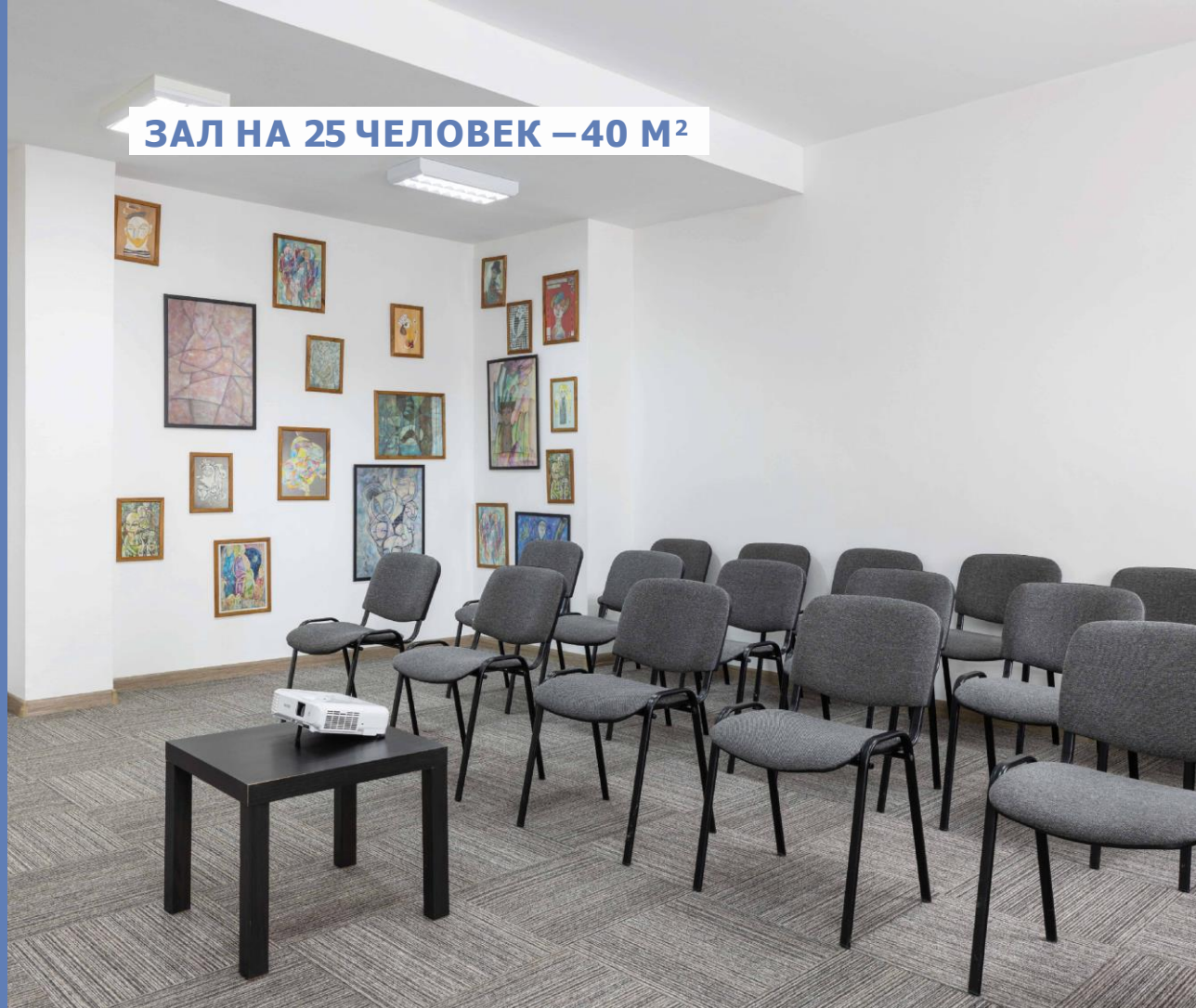
ЗАЛ НА 25 ЧЕЛОВЕК – 40 М 2