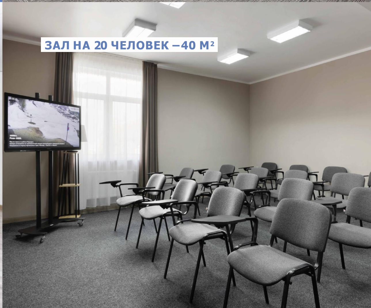
ЗАЛ НА 20 ЧЕЛОВЕК – 40 М 2