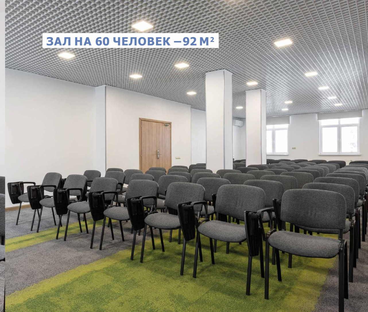
ЗАЛ НА 60 ЧЕЛОВЕК – 92 М 2